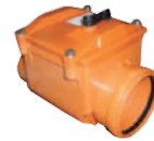
HT-PP Villa Tipi Kilitli Çekvalf