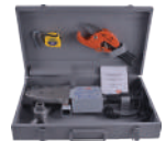
Kaynak Seti - Ekonomik