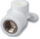
PP-R İç Dişli Batarya Bağlantısı