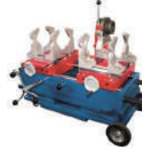
Kaynak Makinası d63-d160 mm