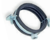
Standart Somunlu Keleçe Metal