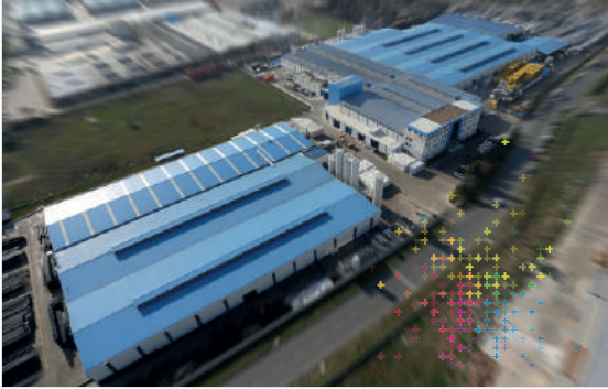
Georg Fischer Hakan Plastik Çerkezköy Üretim Tesisleri

Georg Fischer 1802 yılında kurulmuş İsviçre merkezli bir firmadır. 3 ana iş kolunda faaliyet göstermektedir: GF Piping Systems (Boru Sistemleri), GF Casting Solutions (Hafif Döküm Çözümleri) ve GF Machining Solutions (Talaşlı İmalat Çözümleri). 32 ülkede 45 üretim tesisine sahip GF, boru sistemleri alanında plastik ve metalden yapılmış boru sistemleri konusunda dünyadaki lider kuruluşlardan biridir. GF Piping Systems (GFPS), su ve gazın sanayi, kamu hizmetleri ve yapı teknolojisi içinde güvenli bir şekilde taşınması için sistem çözümleri ve yüksek kaliteli bileşenler üretmektedir. 3 ana gruba sahip GFPS, üst yapı, alt yapı ve endüstriyel alana yönelik olarak 60.000'den fazla ürün sunmaktadır.