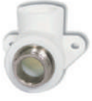
PP-R Bağlantılı Dış Dişli Dirsek