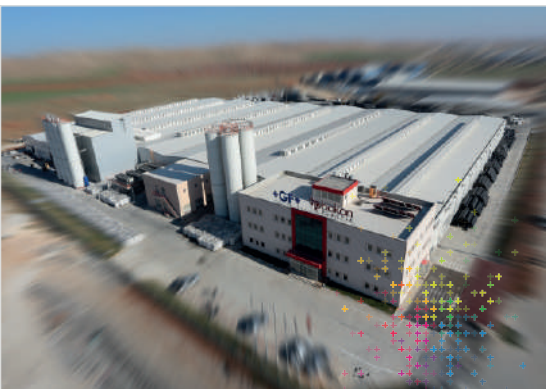
Georg Fischer Hakan Plastik Şanlıurfa Üretim Tesisleri

2013 yılında GFPS, Hakan Plastik'i satın almıştır. Türkiye'nin en önemli plastik boru ve ek parça üreticileri arasında yer alan Hakan Plastik, dünyada bu işin uzmanı olan marka ile güçlerini birleştirerek değişim için önemli bir adım atmıştır. 1965 yılında kurulan Hakan Plastik, Türkiye'de sessiz boruyu ilk üreten firma olarak büyük başarılarla imza atmış, kuruluşundan beri gelişime ve değişime verdiği önemi ürün ve hizmetlerine de yansıtmıştır.